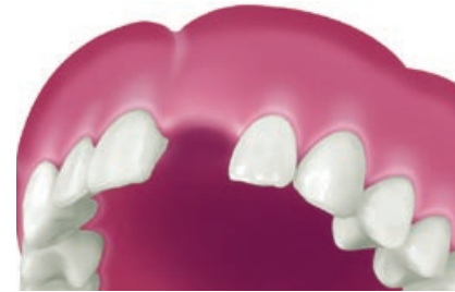
Situatie na verlies van een tand