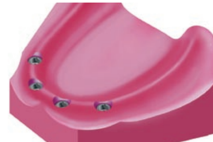
Vier implantaten in de onderkaak.