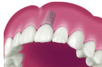
Implantaat voorzien van een kroon