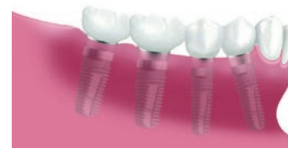
Vier implantaten elk voorzien van een kroon