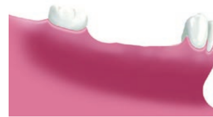
Situatie na verlies van meerdere kiezen

Met implantaten is het mogelijk weer een vaste voorziening terug te krijgen. Er worden dan op de plaatsen van de ontbrekende gebitselementen implantaten geplaatst met daarop enkelvoudige kronen of een brug.