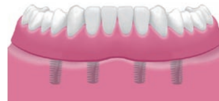
Vier implantaten voorzien van een uitneembare prothese.