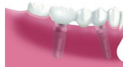
Twee implantaten voorzien van een brug